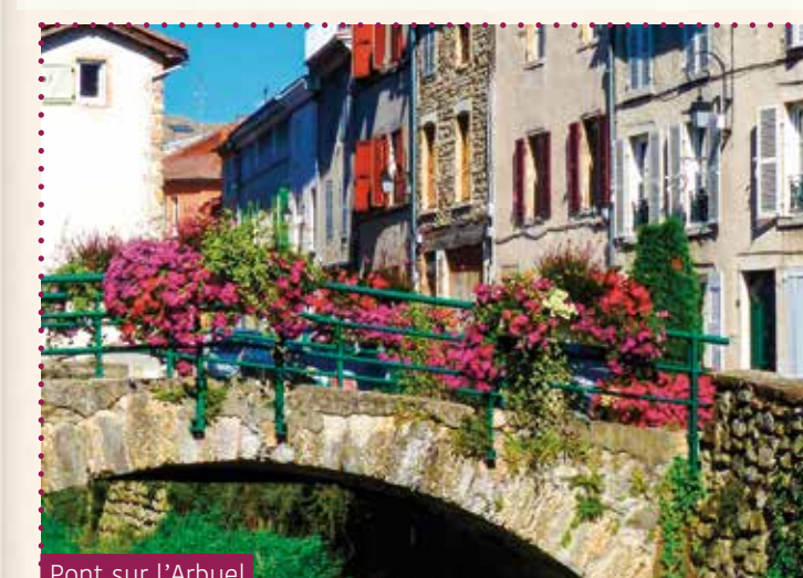
Le Pont sur l'Arbueil

Les visiteurs, à pied, à vélo, à moto, en voiture... trouvent place à l'hôtel, en gîtes et chambres d'hôtes, dans les campings, dont un spécial vélo/moto.