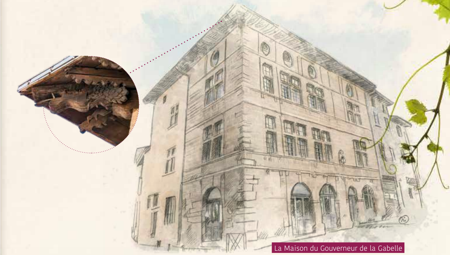
La Maison du Gouverneur de la Gabelle