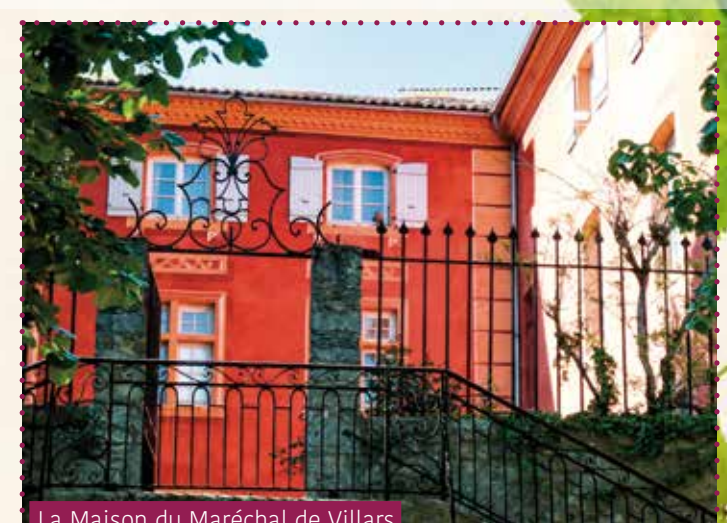
La Maison du Maréchal de Villars