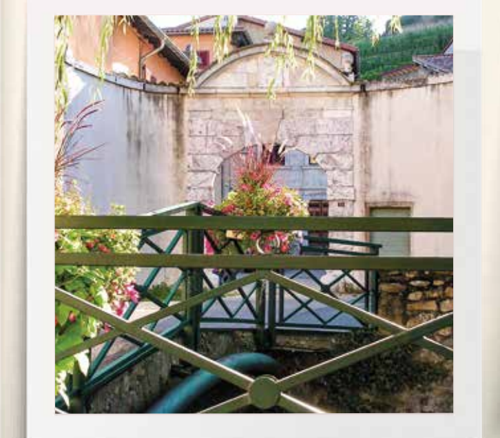
La Maison du Maréchal de Villars